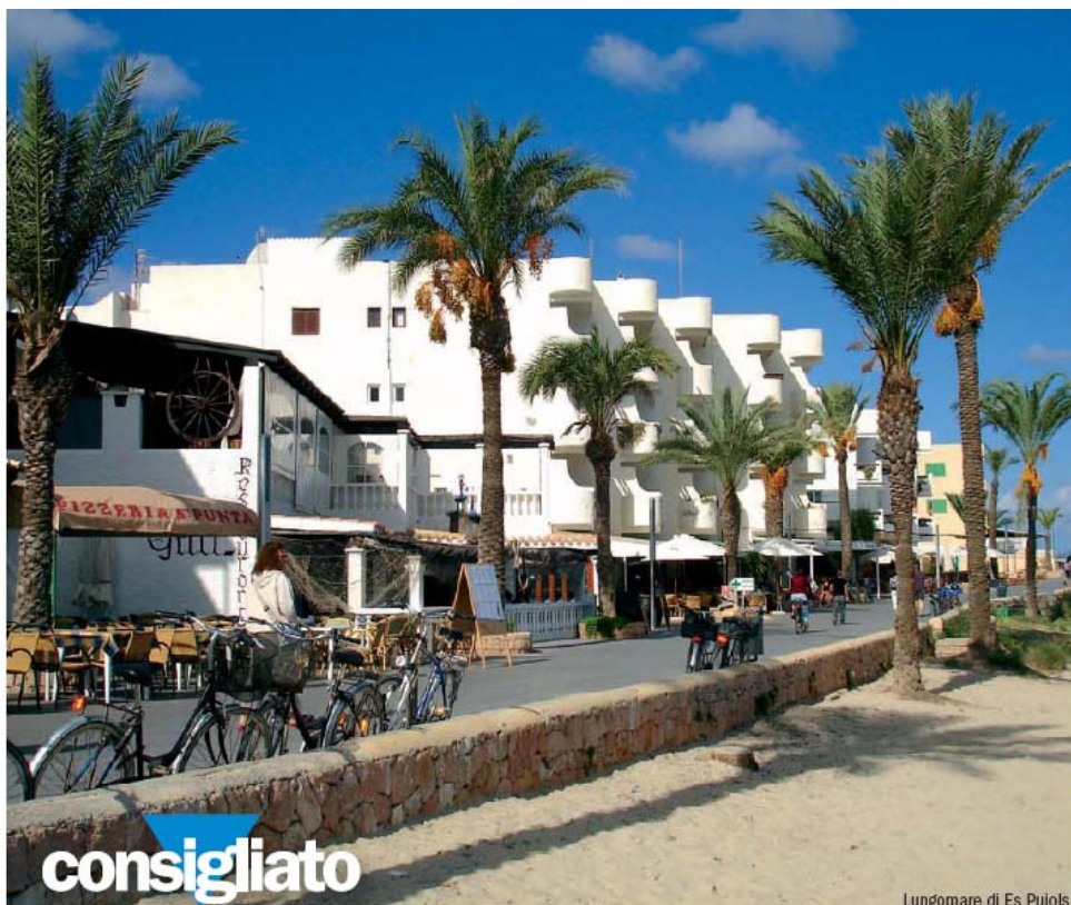
Lungomare di Es Pujols